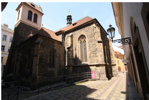
Kostel sv. Martina ve zdi

Od Národního muzea pokračujeme po přechodu pro chodce s nízkými bezbariérovými nájezdy přes magistrálu dolů po Václavském náměstí. Téměř celé Václavské náměstí je vydlážděno malými chodníkovými kostkami, které jsou v několika místech nerovné. Přibližně uprostřed horní části náměstí, v místě, kde je bezbariérový přejezd na druhou stranu, náměstí překřížíme. V těchto místech se také můžeme občerstvit v bezbariérové pizzerii s prostornou bezbariérovou toaletou vhodnou i pro elektrické vozíky. Poté sjedeme náměstím (uprostřed náměstí při přechodu tramvajové trati z ulice Vodičkova je zapotřebí tento