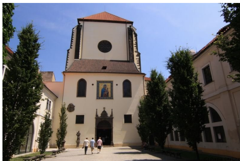
Kostel Panny Marie Sněžné

Kostel Panny Marie Sněžné založil Karel IV. na památku své korunovace v roce 1347. Podle Karlova plánu měl kostel být přes sto metrů vysoký a měl tvořit dominantu Nového Města, ale jeho stavba nebyla nikdy dokončena. Stávající budova je pouze presbyteriem zamýšlené trojlodní stavby. Měří 33m a byla dokončena v roce 1397. Název kostela pochází z legendy, kdy se ve 4. století papeži ve snu zjevila Panna Marie a přikázala mu, aby na místě, kde se v srpnu objeví sníh, nechal postavit kostel, který jí bude zasvěcen. Kostel Panny Marie Sněžné původně patřil Karmelitánům, ale později ho získali Františkáni, kteří zde vybudovali nádhernou Františkánskou zahradu se záhony osázenými léčivými bylinami. Během husitských válek byl kostel poškozen a úplně zničena jeho věž. V této době zde kázal známý radikální husitský kněz Jan Želivský, jehož kázání bylo hojně navštěvováno hlavně chudinou. Odtud také Želivský v roce 1419 vedl své radikální husity k Novoměstské radnici, kde tehdy proběhla tzv. První pražská defenestrace, při níž byli někteří novoměstští radní vyházeni z oken na připravené hroty kopí.