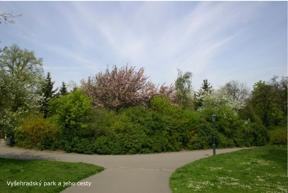
Vyšehradský park a jeho cesty

zejí z českého bájesloví a jde o dvojice Lumír a Píseň, Ctirad a Šárka, Záboj a Slavoj a Přemysl s Libuší. Také se zde nacházejí známé Čertovy sloupy, tři kusy kamenného patrně časoměrného sloupu starých Slovanů z pohanských dob. Sloupy váží dvě a půl tuny a dohromady měří 6 metrů. Materiál granodiorit se nikde v blízkosti nenachází a při ozáření sluncem vydává lehký zápach síry. Není tak divu, že je opředen mnoha pověstmi. Najdeme zde i jezdecký pomník sv. Václava od Jana Jiřího Bendla z roku 1678, který původně stával na Václavském náměstí uprostřed kašny.