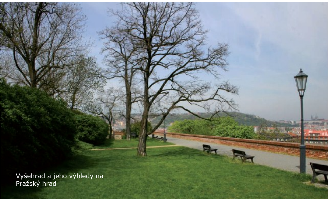
Vyšehrad a jeho výhledy na Pražský hrad

Naší první procházku zahájíme u výjezdu z metra trasy C Vyšehrad, kde se hned na počátku cesty můžete zastavit na krátkém občerstvení v Café Vyšehrad. Restaurace je bezproblémově bezbariérově přístupná i s prostornou bezbariérovou toaletou v těsné blízkosti. Z tohoto místa vyjedeme po nájezdové rampě těsně u výstupu z metra a vydáme se podél zdi ochozu Kongresového paláce lehce z kopce pozvolnou asfaltovou cestou k ulici Na Bučance. Ulici můžeme vzhledem ke slabé dopravě, která zde panuje projet, jak po chodníku, tak po silnici. Za chvíli před sebou uvidíme bránu Vyšehradské pevnosti. Zde nás očekává první malé úskalí naší cesty, které většina z vás jistě dobře zná a tím je malá křižovatka před námi, která je vybudována z velkých kostek tzv. kočičích hlav, které mohou při troše nepozornosti značně poškodit přední kolečka mechanických vozíků. Po