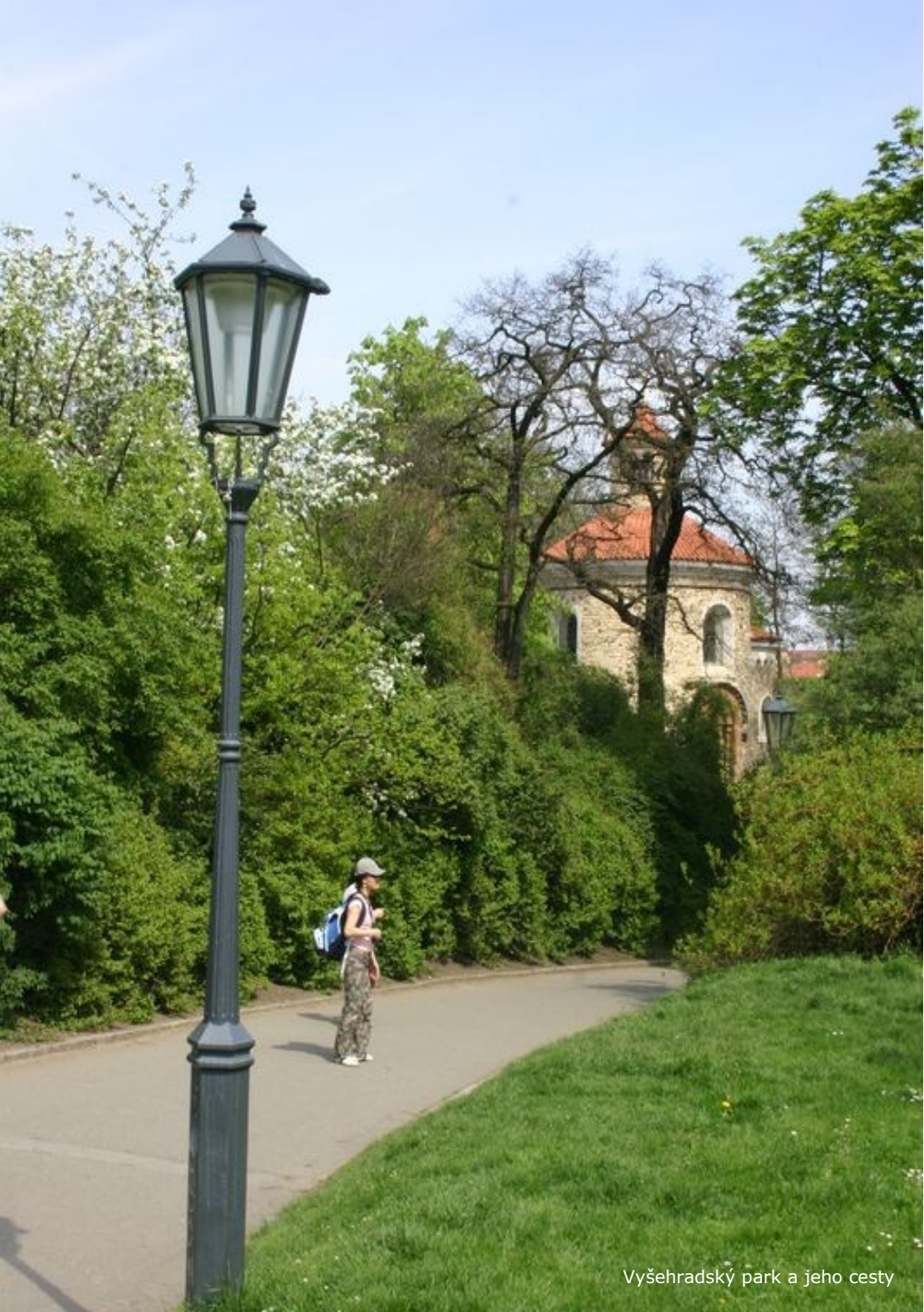
Vyšehradský park a jeho cesty