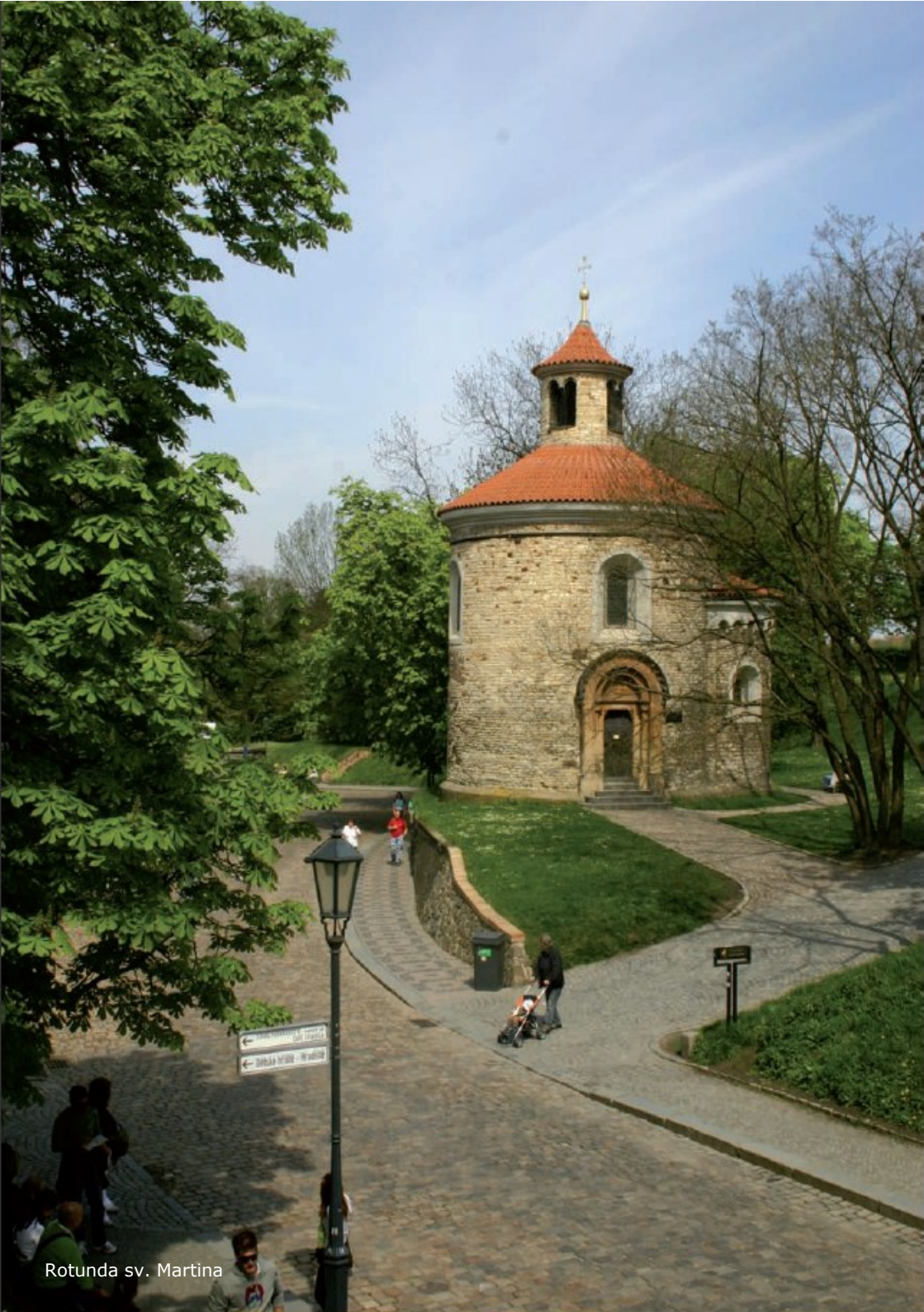
Rotunda sv. Martina