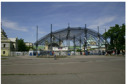
Výstaviště v Holešovících

Naše vytyčená trasa nás povede po cyklistické stezce A1, na kterou se napojíme hned za lávkou, a která nás přivede k orientační mapě parku Stromovka. Pak podjedeme železniční most a dojedeme na rozcestí, z něhož pokračujeme k padlému stromu Platan, který je dnes vzpomínkou na povodně 2002. Odtud pokračujeme k rybníčkům. Zde vyjedeme krátký prudký svah a pokračujeme po hlavním okruhu Stromovky k hlavní bráně Výstaviště. Od Výstaviště, které jsme si podrobněji představili v trase č.5, pokračujeme podél parkoviště ulicí U výstaviště směrem k Holešovickému nádraží. Podjedeme pod železničním mostem a směřujeme Partyzánskou ulicí až k světelné křižovatce, za kterou je vstup do vestibulu vlakového nádraží a metra a kde také trasa končí.