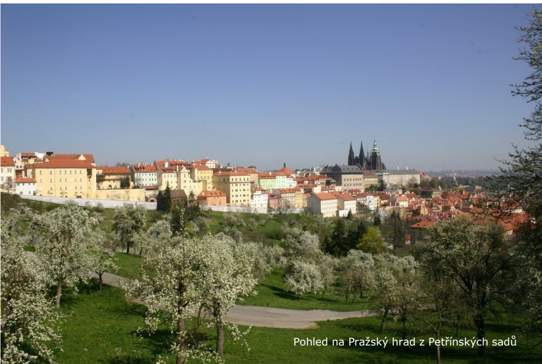
Pohled na Pražský hrad z Petřínských sadů

Po úspěšném zdolání krátkého stoupání se před námi otevře pohled do vrchní části Petřínských sadů , které patří mezi nejrozsáhlejší zelené