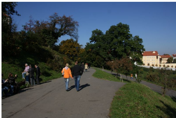
Cesta kolem Štefánikovy hvězdárny

Trasu, která nás zavede přes Petřínské sady na Poohořelec zahájíme u zastávky autobusu Stadion Strahov. Na toto místo je možné dostat se různými bezbariérovými nízkopodlažními linkami pražské MHD. Vycházku začínáme na místě, kde jsme ukončili naši poslední trasu z obory Hvězda. O Strahovském stadionu se zde ze stejného důvodu již zmiňovat nebudeme. Informace o něm naleznete v textu předchozí vycházky. Od autobusové zastávky se rovnou vydáme po pravém chodníku s asfaltovým povrchem k ulici Jezdecká, kde zatočíme vpravo do areálu vysokoškolských kolejí Strahov. Téměř na samém začátku ulice Jezdecká se nachází budova