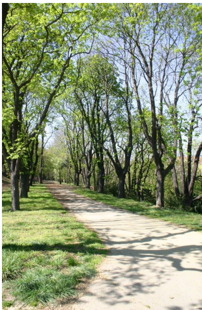
Cesta Petřínským i sady

Od Petřínské rozhledny se vydáme cestou vlevo a po několika metrech se před námi otevře prostor, kde po pravé straně uvidíme Bludiště, za ním kapli Božího hrobu a vlevo kostel svatého Vavřince . Z těchto objektů je bezbariérové pouze Bludiště, ale zbylé dva stojí za prohlídku alespoň zvenčí. Kostel sv. Vavřince, je původně románská jednolodní svatyně. V blízkosti tohoto kostela se konaly ve středověku popravy. V 18. století byl kostelík barokizován a tato jeho podoba mu zůstala dodnes. Kaple Božího hrobu je z roku 1737. Její čelní stěna je zdobena sgrafitem Zmrtvýchvstání Krista. V těsné blízkosti této kaple je tzv. Bludiště , pavilon Klubu českých turistů z roku 1891, vybudovaný jako miniaturní rekonstrukce tehdejší vyšehradské gotické brány Špička.