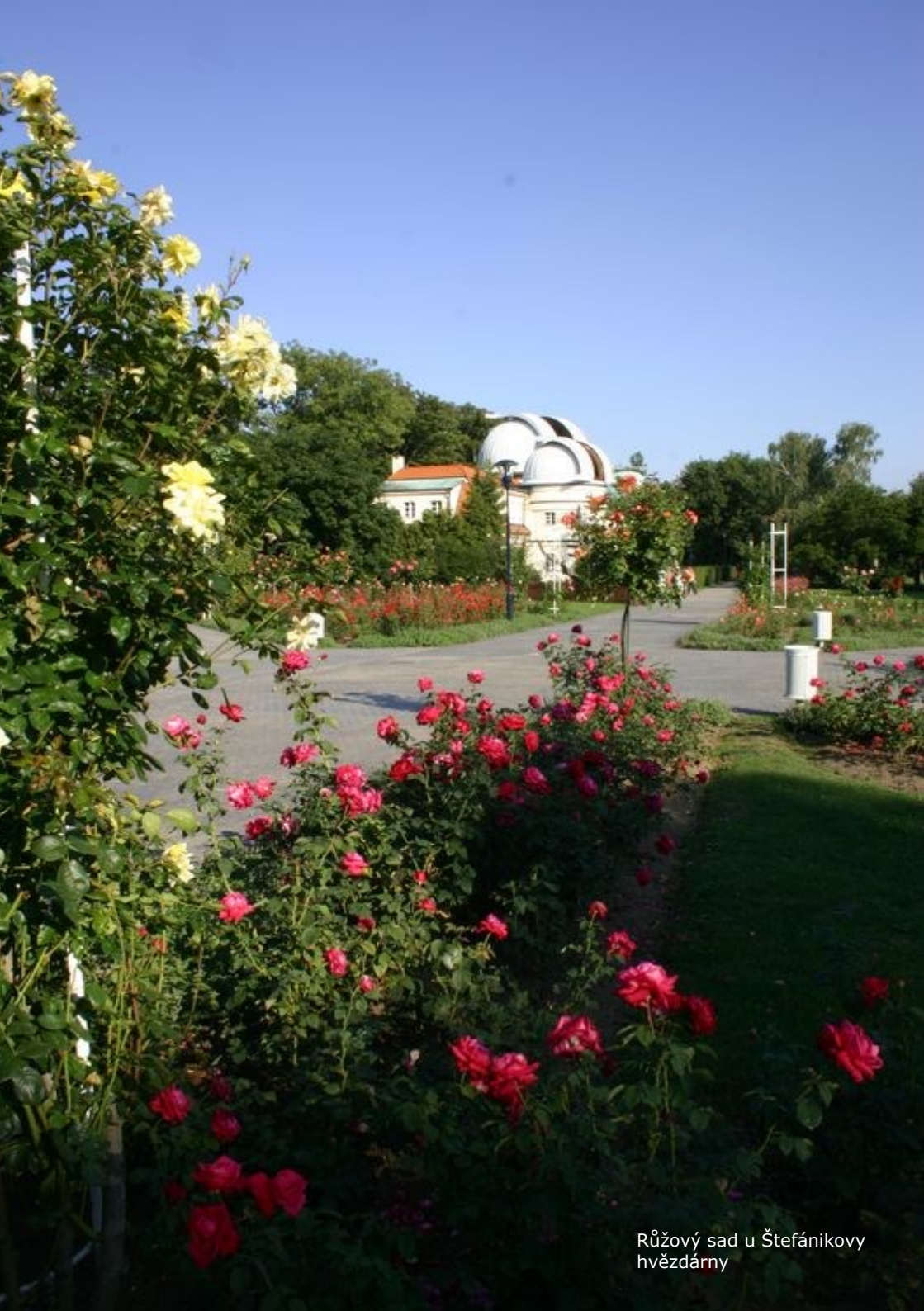
Růžový sad u Štefánikovy hvězdárny