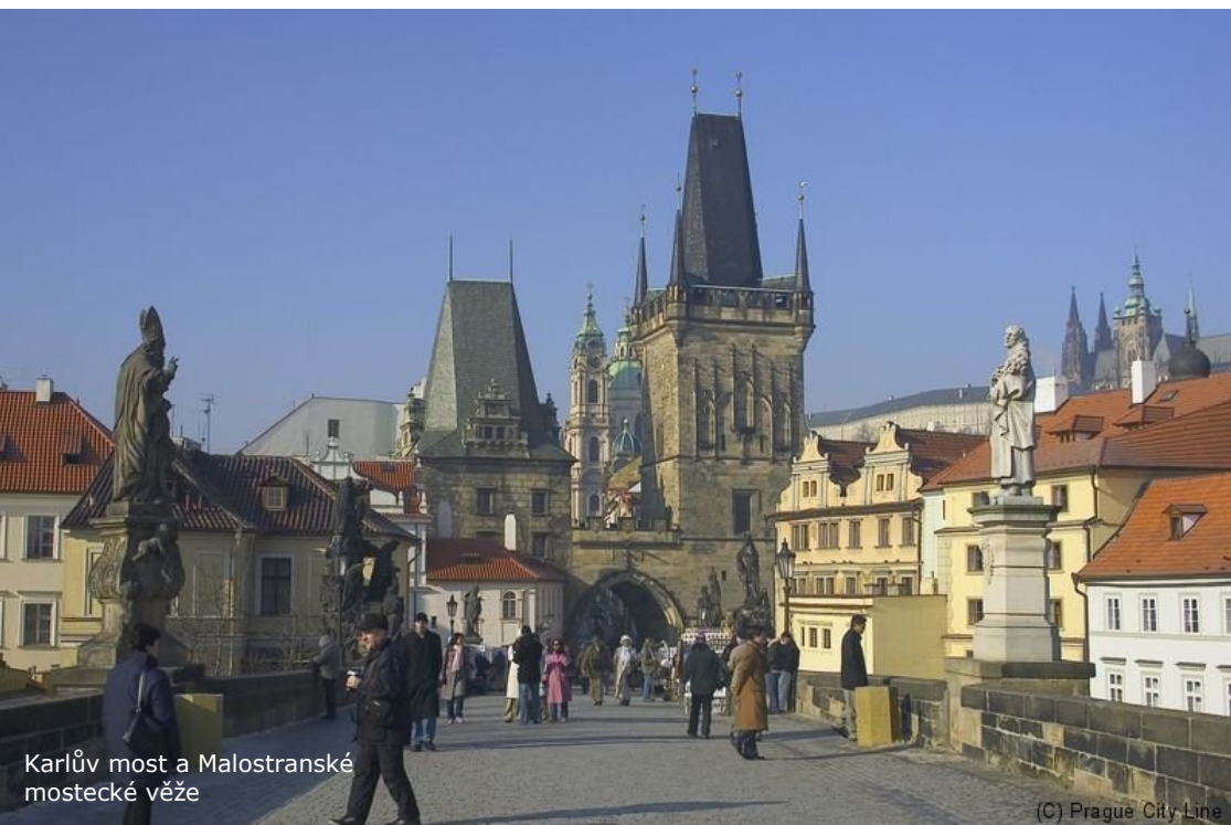
Karlův most a Malostranské mostecké věže