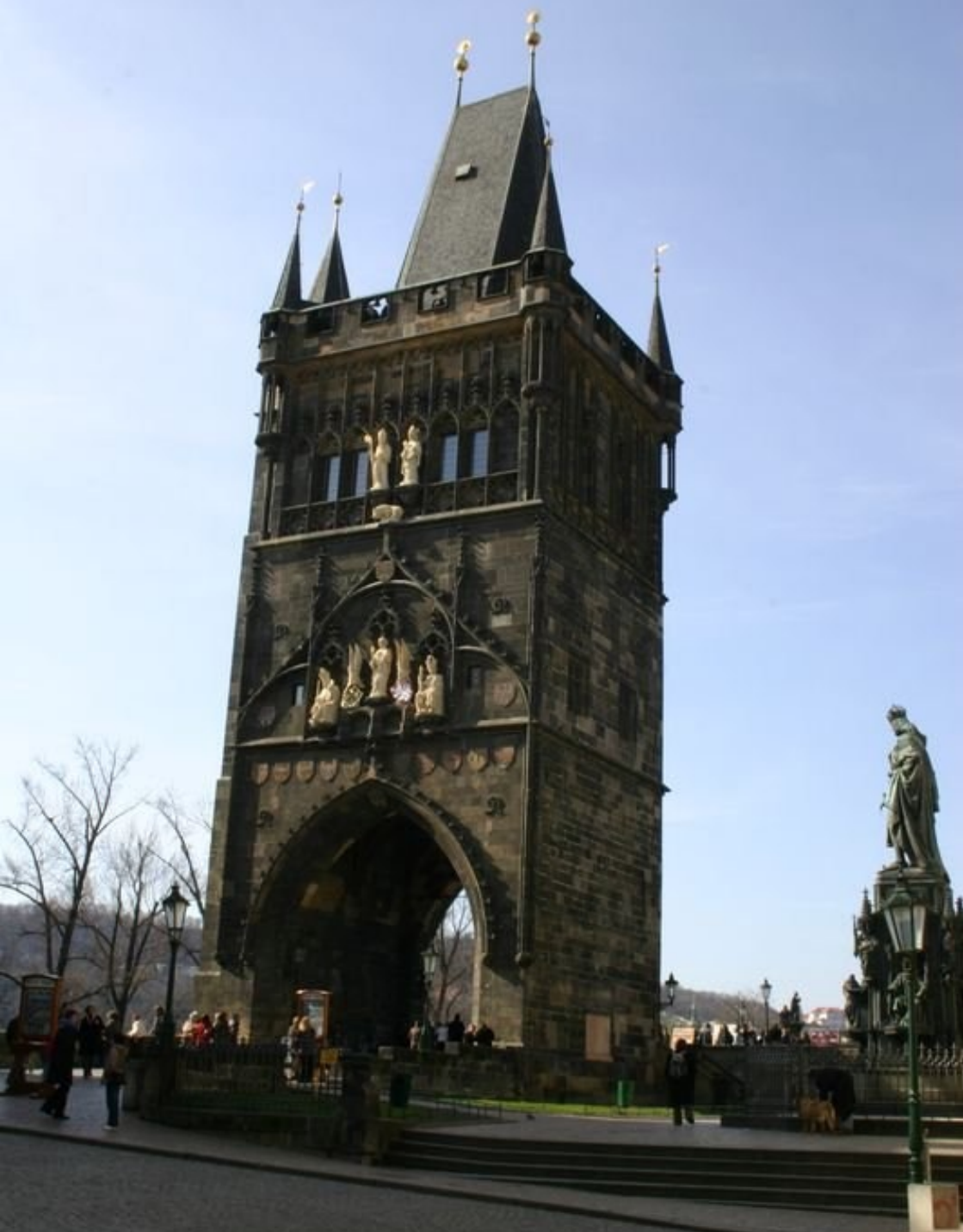
Staroměstská mostecká věž