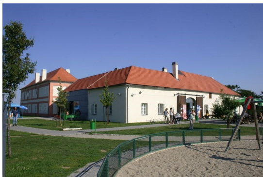
Usedlost Tomanova louka uprostřed Ladronky

v díle člověka. Šesticípá hvězda (hexagram), vzniklá spojením dvou rovnostranných trojúhelníků, navíc symbolizovala spojení dvou protikladných sil do vzájemné harmonie, osvěcovala a dodávala životní sílu. Zjevením hvězdy - komety bylo předznamenáno i narození Ježíše. V půdorysu stavby se objevuje i symbolika hvězdy pětícípé, pokud se odmyslí paprsek vyhrazený schodišti. Do pentagramu bývala tradičně vpisována rozpažená postava člověka (viz Leonardo