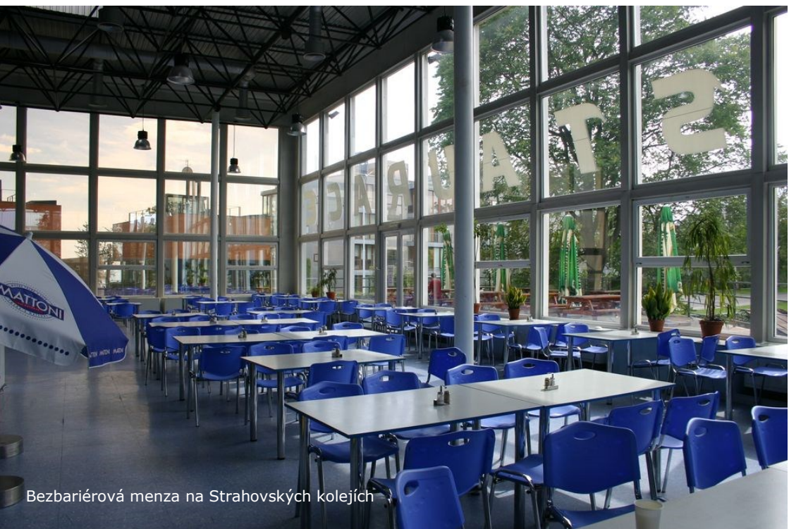
Bezbariérová menza na Strahovských kolejích

vozem. Jedeme po levé straně vozovky. Po přibližně padesáti metrech přejedeme křižovátku s ulicí Skokanská se napojíme na ulici Ankerská. Touto ulicí již pokračujeme po pravém chodníku až ke Strahovskému stadionu, kde naše dnešní trasa u zastávek autobusů končí.