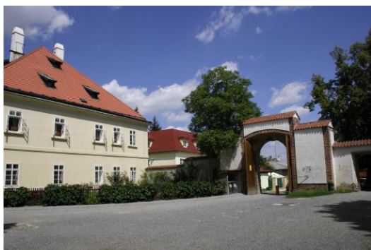
Vstupní brána Obory Hvězda

Od autobusové zastávky Vypich směřujeme ke křižovatce Ankerská a Na Vypichu. Pro tuto cestu nejlépe zvolíme chodník po levé straně vozovky. Po necelých padesáti metrech jízdy zatočíme vlevo a pokračujeme ulicí Na Vypichu podél dopravního hřiště až k boční vstupní bráně obory Hvězda. V tomto úseku trasy je převážně asfaltový povrch. Místy je narušen výtluky, kterým je nutné se pozorně vyhýbat. Po průjezdu bočním vchodem do areálu se širokou cestou vpravo podél budov napojíme na jednu z hlavních cest oborou. Až k letohrádku Hvězda budeme projíždět parkovou úpravou mezi vzrostlými buky, duby nebo habry. Cesta, jak již bylo napsáno vede po rovině na šotolině, za sucha je pohodlná, po dešti je třeba k jejímu zvládnutí vyvinout trochu větší sílu. Pokud na tuto vyjížďku vyrazíte s doprovodem, tak Vám nebude činit žádné potíže. Po přibližně patnácti minutách jízdy dojedeme k letohrádku Hvězda.