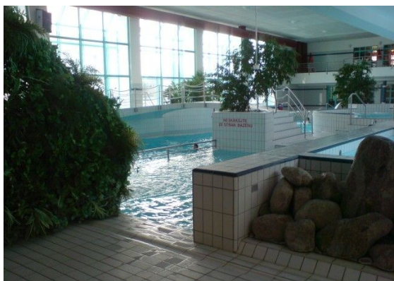
Aquapark Městské lázně

na levé straně budovy, kde je brána z nájazdem pro vozíčkáře. Pro větší pohodlí cesty je vhodné se nejprve telefonicky ohlásit na recepci Filharmonie, odkud vám přijdou ochotně pomoci. Bezbariérový prostor pro vozíky je pak přímo u hlediště. V budově Filharmonie najdete i bezbariérové WC. Restaurace a vinárna jsou bohužel pro vozíčkáře nepřístupné.