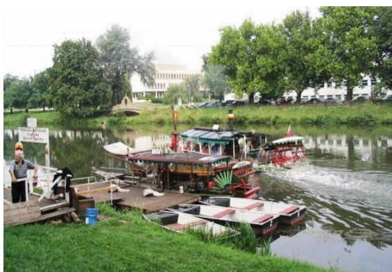
Lodě na Tyršově nábřeží

Městské lázně. Zde můžete strávit pár chvil sportovním vyžitím a zaplavat si. Pro vstup do aquacentra musíte objet budovu z levé strany, až dojedete ke vstupu do plaveckého bazénu. Ke vstupu využijete nájezdovou rampu hned vedle schodů. Dveře jsou zde s automatickým otevíráním. Do cody vám pak pomůže speciálně upravená plošina.