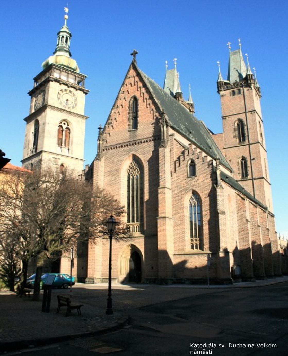
Katedrála sv. Ducha na Velkém náměstí