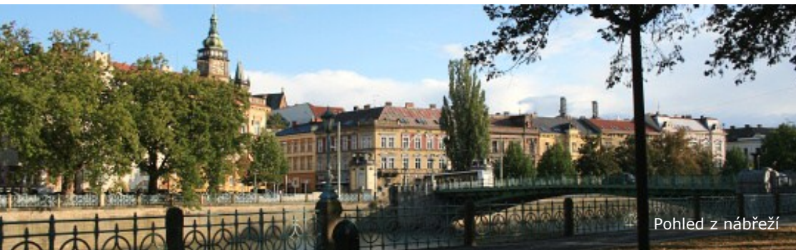
Pohled z nábřeží