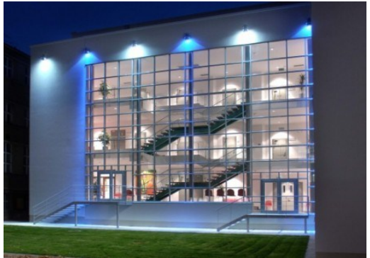
Budova Filharmonie Hradce Králové

Hradec Králové je považován za jednu z nejkrásnějších českých metropolí. Historie tohoto města sahá až k roku 1225, a díky tomu je Hradec jedním z nejstarších měst v Čechách. Během svého dlouhého vývoje získal mnoho tváří, býval věnným městem českých královen i baštou husitského odboje, sídlem církevní protireformace i významným kulturním střediskem doby obrození. Jeho stoleté působení v roli vojenské pevnosti skončilo bitvou u Chlumu v roce 1866.