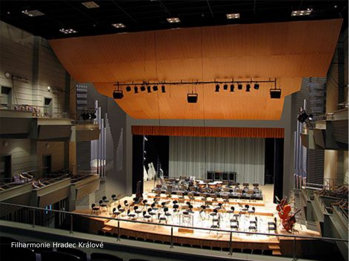
Filharmonie Hradec Králové

Filharmonie patří k novodobější historii města, byla založena v roce 1978 pod názvem Operní orchestr města Hradec Králové. Dnes je pro své bohaté zkušenosti s prováděním velkých oratorních děl světové hudební literatury vyhledávaným profesionálním partnerem pro domácí a především zahraniční sborová tělesa. Pokud byste se zde rozhodli, že navštívíte jeden z jejích koncertů, nevstupíte do budovy hlavním vchodem, kde je plno schodů, ale použijete vchod