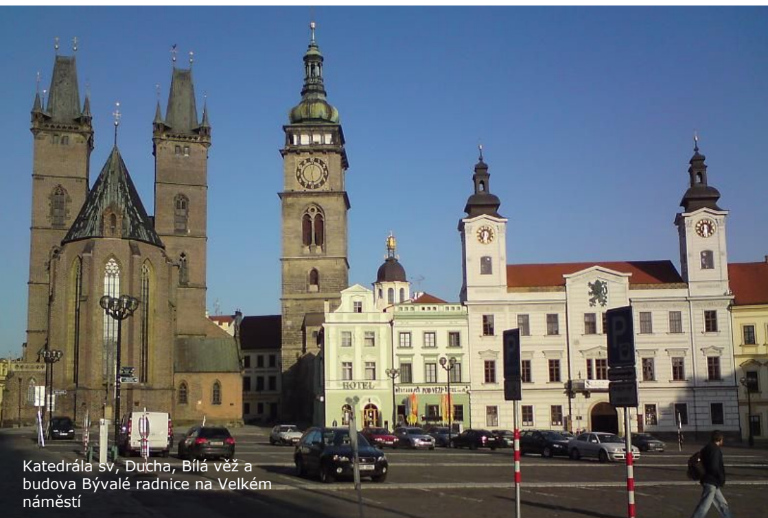
Katedrála sv. Ducha, Bílá věž a budova Bývalé radnice na Velkém náměstí

budovou zavolat na recepci pro asistenci.