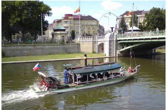
Lodě na Tyršově nábřeží

pláze a je zde vytvořena umělá pláž, na které je moc příjemně. Na této trase od řeky vyjedeme na další most – Pražský, přejeďte ho opět na druhou stranu řeky a po Eliščině nábřeží se vrátíte zpět směrem k náměstí Osvoboditelů.