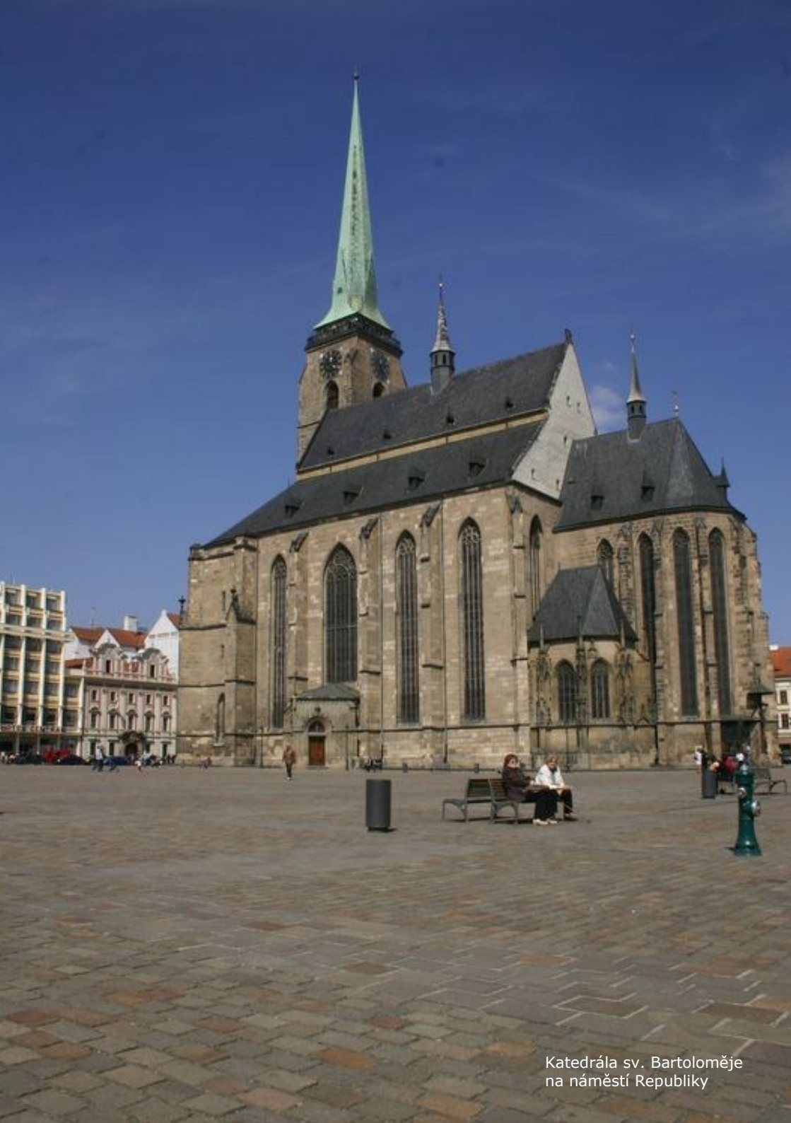
Katedrála sv. Bartoloměje na náměstí Republiky