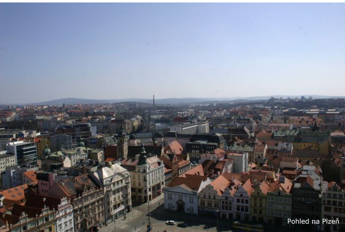
Pohled na Plzeň

expozice modelu historického centra města v měřítku 1:200 v zadní části mazhauzu radnice, vstup doporučujeme s asistencí. Před radnicí také nepřehlédnete morový sloup, který byl postaven v roce 1681 jako poděkování za mírný průběh morové epidemie. Nepřehlédnutelnou dominantou náměstí je katedrála sv. Bartoloměje .