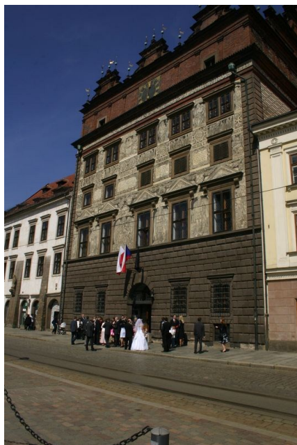
Budova radnice na náměstí Republiky

Naše prohlídka začíná opět na náměstí před budovou radnice přímo v centru městské památkové rezervace. Zde jsou umístěna 4 parkovací místa pro vozidla přepravující zdravotně handicapované osoby. Vedle renesanční budovy radnice je turistické informační centrum, kde získáte všechny potřebné informace nejen k historii města, ale i k bezbariérovým možnostem ve městě. V budově samotné radnice se nachází stálá