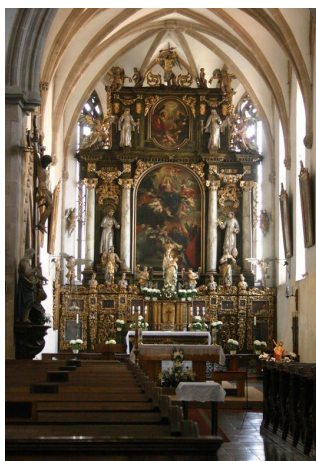
Katedrála sv. Bartoloměje - interiér

Stavba chrámu sv. Bartoloměje začala po r. 1295 a byla dokončena počátkem 16. století. Na hlavním oltáři můžete vidět opukovou sochu Plzeňské madony z r. 1390, jedna z nejhodnotnějších soch tzv. „krásného stylu“ českých madon. Šternberská kaple s visutým svorníkem pochází z 1. pol. 16. stol. V r. 1993 zřídil papež Jan Pavel II. v Plzni biskupství a chrám sv. Bartoloměje se stal katedrálou. Věž katedrály, která bohužel není bezbariérově přístupná, je se svou výškou 102,6 m nad zemí nejvyšší chrámovou věží v Čechách.