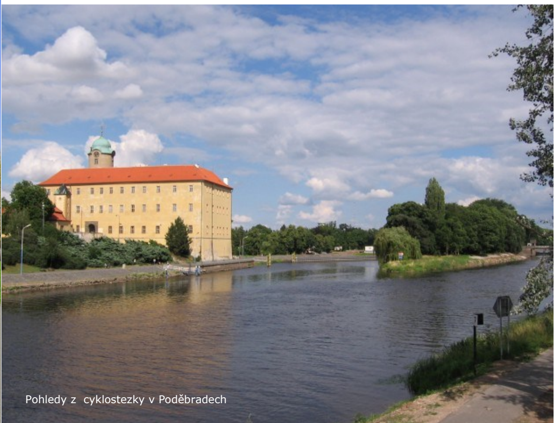
Pohledy z cyklostezky v Poděbradech

Během třicetileté války při pustošení Švédy a Sasy dochází ve městě k rabování a četným požárům. V roce 1681 zachvacuje celé město požár a jsou zničeny všechny dřevěné domy. Po této události je nařizeno na náměstí stavět domy pouze zděné. Zároveň jsou zbořeny městské hradby a vodní příkopy. Obrovský