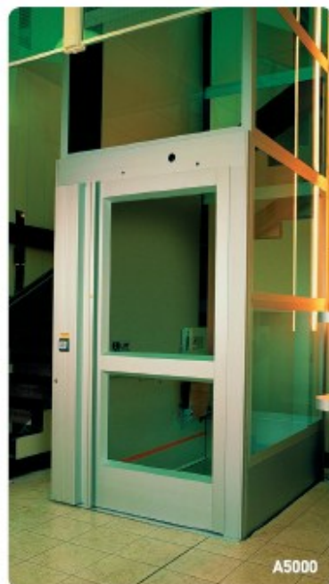
Vertikální zdvihací plošina typu