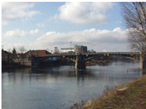
Nymburk - Železniční most

Tato trasa je více sportovně zaměřená a provede vás krásnou přírodou mezi Nymburkem a Poděbrady. Začátek trasy je na parkovišti v Nymburce pod mostem. Na parkovišti je 5 vyhrazených míst pro vozíčkáře. Parkování je zde pro vozíčkáře zdarma. Již zde se můžete strávit pár pěkných chvil a dívat na řeku a třeba i na projíždějící loď plavební komorou.