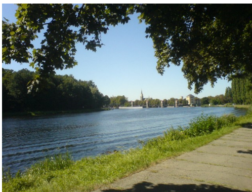
Pohledy z cyklostezky

lostezku č. 24 a zároveň můžete sledovat červenou turistickou značku. Po pár metrech se vám naskytne krásný pohled na středověké opevnění. Pokračujte dál směrem ke zdymadlu. Zde je kratší úsek cesty přes můstek vydlažděn. Podél Labe dojedete po asfaltové cyklostezce až k místu, kde je nutné přejet menší můstek, jehož povrch tvoří dřevěné fošny. Poté opět po asfaltové cestě dojedete až do Poděbrad. Z cyklostezky se dostanete do města po nově vybudovaném nájezdu (nutný doprovod – prudké stoupání), nebo pokračujte dál podél Labe. Projedete kolem zámku a u dětského hřiště, v místě kde je most pro pěší přes řeku, odbočíte doleva a kolem kostela dojedete po chodníku až na nám. Jiřího z Poděbrad. Odtud se můžete vydat na procházku po lázeňské kolonádě. Zde jsou dvě přístupné kavárny a po procházce lázeňským parkem se stejnou cestou vrátíte zpět.