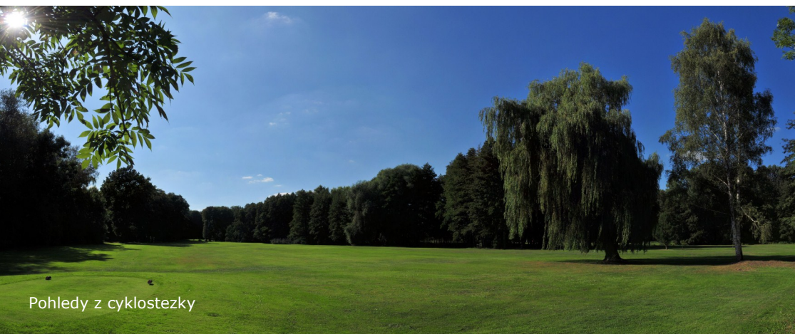
Pohledy z cyklostezky

Z parkoviště se vydáte k řece a na pravém břehu řeky Labe se napojíte na cyk-