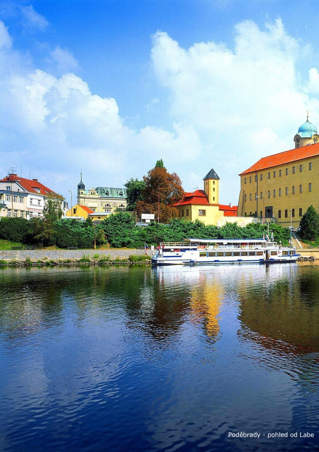
Poděbrady - pohled od Labe