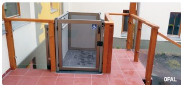
Vertikální zdvihací plošina typu