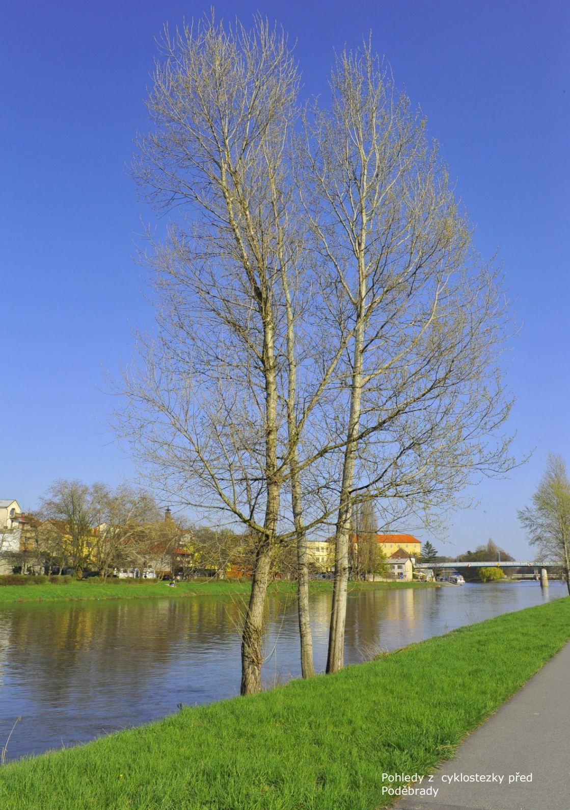
Pohledy z cyklostezky před Poděbrady